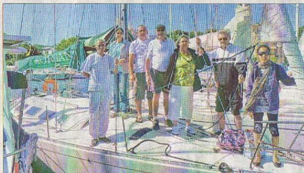
L'ANS a présenté un équipage sur le "Morgane".