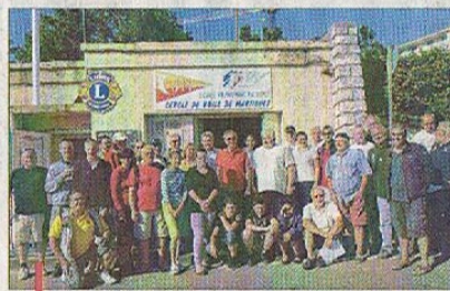
De nombreux bénévoles étaient là pour honorer cette initiative du Lions club.

La prochaine réunion de l'ANS est ouverte à tous le mercredi 27 juin à 11h. 06 24 64 77 46